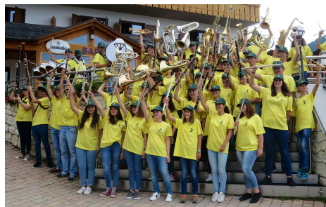
Foto di gruppo CEM 2018

Casa Sant'Antonio - Loc. Valgiardini - Asiago (VI) Tel. 0424 194 6344 - csa@svaga.it http://www.svaga.it/casa-santantonio/